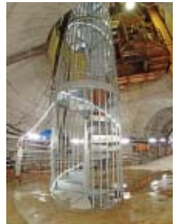
らせん階段 (約90段 ビル8階建相当)

工事現場での安全の確保のため、 小学生の方は4年生以上で保護者同伴 でお願います。また入坑の際は、安全装備(つなぎ服・反射ベスト・ヘルメット・安全長靴・軍手・坑内PHSなど)を着用して頂きます。工事現場でのため、狭くて急な階段等もあります。 階段の昇降等が困難な方など自立歩行に支障のある方や高所、閉所恐怖症の方などは研究坑道に入坑できない場合がありますので、事前にご確認をお願いいたします。 なお、深度500mの研究坑道の見学の際には、 約90段(ビル8階建相当の高さ)のらせん階段があり、昇降は体力的にも大きな負担となりますので、十分にご検討の上お申し込みください。また、飲酒されている方、妊娠中の方、体調がすぐれない方はご遠慮いただいております。 予約後であっても 工事や現場の状況により入坑できなくなる場合がありますので、予めご了承下さい。